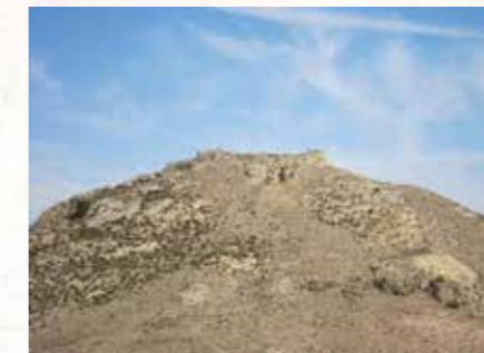
Castillo de Celda