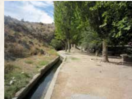
Fuelle de las Tosquillas