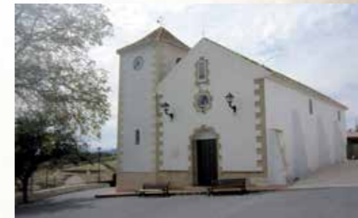
Iglesia de los Royos