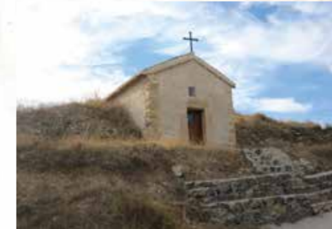
Ermita Virgen de los Remedios