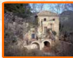
Torre de Las Fuentes