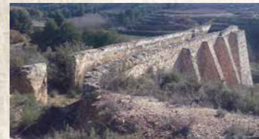
Salto de agua de la fábrica de luz