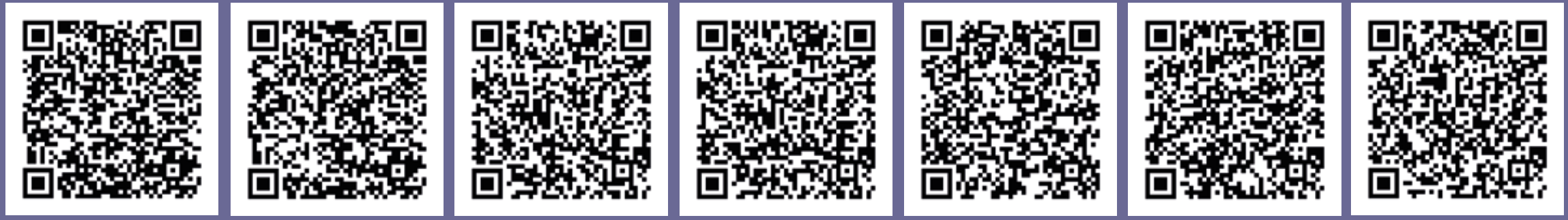
Caravaca genérica Cruz de Caravaca Fiestas de Caravaca Año Jubilar Monumentos Red de Museos Yemas de Caravaca

Si quieres conocer más sobre Caravaca de la Cruz puedes consultar nuestros folletos online escaneando estos códigos QR con tu teléfono.